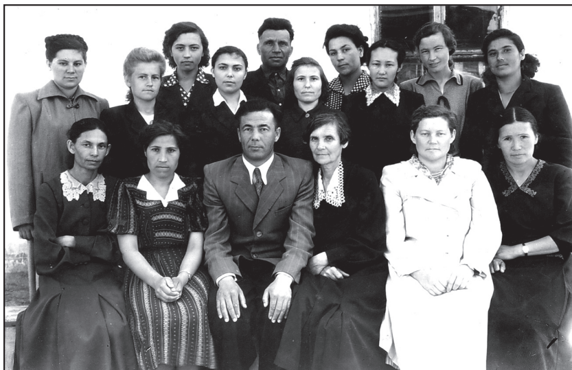
Коллектив учителей татарской средней школы № 8 города Тары. 1955 год.