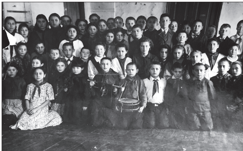
Пионерская дружина татарской средней школы № 8 города Тары. 1949 год.